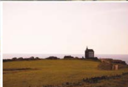
Arriba, el imponente palacio de la Magdalena, famoso por haber sido lugar de vacaciones de los reyes Alfonso XIII y Victoria Eugenia durante 17 años. A la izquierda, uno de sus decorativos salones. Y el Panteón Inglés, monumento funerario del siglo XIX en la costa norte santanderina.

de primera calidad y la deliciosa cocina popular cántabra. Los más foodies deben darse una vuelta por alguna de los tres mercados de la ciudad para conocer de cerca la riqueza de los productos de la zona. La oferta es variada: bares con sabor local, tascas para tomar pinchos, tabernas... Y lo mejor es que ahora reservar mesa en los mejores restaurantes ya no es un problema, como ocurre en verano.